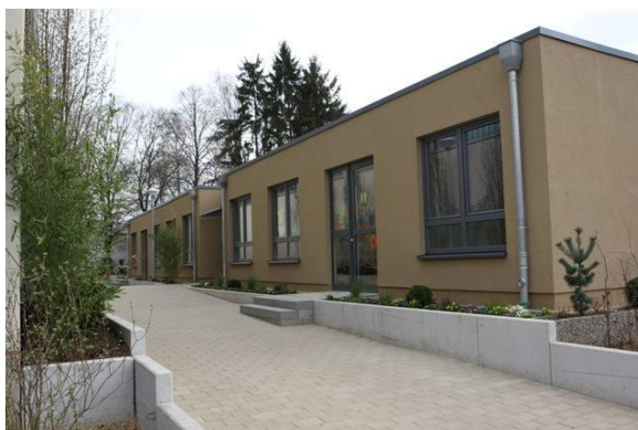
Wisestrooss – rue des prés